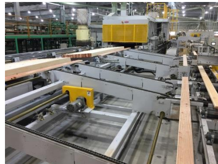
(左上)高周波プレス／(右上)回転プレス ※木材に接着材を塗布して貼り合わせる装置