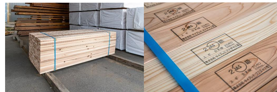
(左)国産杉ディメンション製品