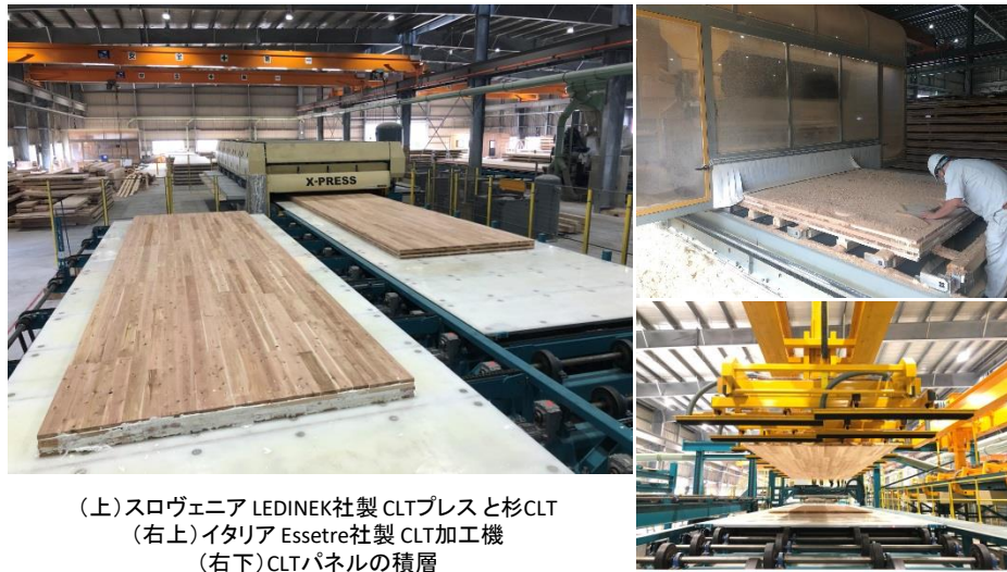
(上)スロヴェニア LEDINEK社製 CLTプレスと杉CLT (右上)イタリア Essetre社製 CLT加工機 (右下)CLTパネルの積層

CLTとはCross Laminated Timberの略称で、近年ヨーロッパで新たに開発され、注目されている木質建材です。ひき板を並べた後、繊維方向が直交するように積層接着した材料で、厚みのある大きな板であり、建築の構造材の他、土木用材、家具などにも使用されます。