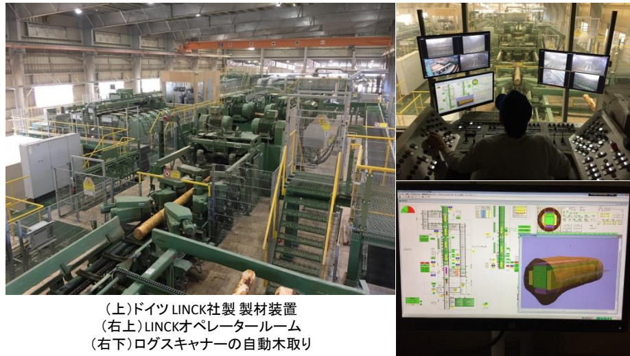
(上)ドイツ LINCK社製 製材装置 (右上)LINCKオペレータールーム (右下)ログスキャナーの自動木取り

2018年3月に新工場が完成し、生産設備を一新しました。新工場ではドイツ LINCK社製「チップパーキャッター及び丸鋸式製材装置」をはじめ、ヨーロッパの先進木材加工機械を積極的に導入し、これまでにない高効率な工場を実現しています。