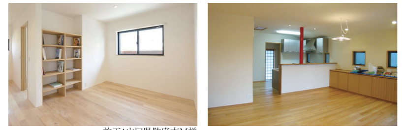
施工:山口県防府市M様