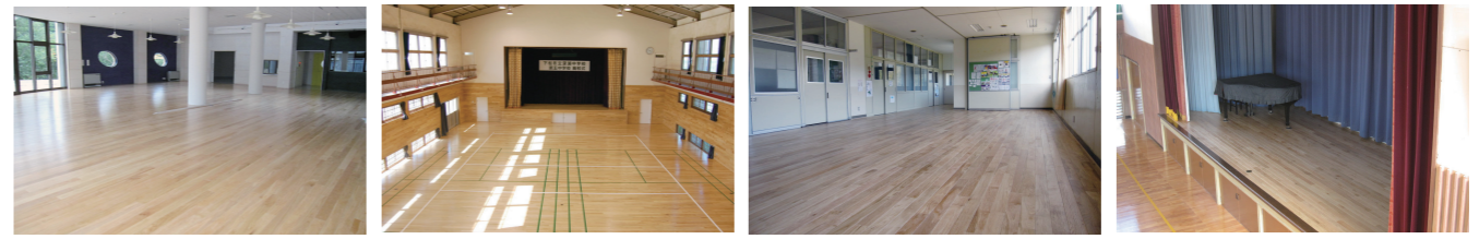
油谷小学校 多目的ルーム (長門市) 下松市体育館施設 (下松市) 向津具小学校 図書コーナー (長門市) 向津具小学校 屋内運動場ステージ (長門市)