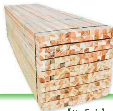
ギヤング挽 【G垂木】 4m 45×45