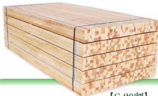
ギヤング挽 【G20割】 2m 27×36