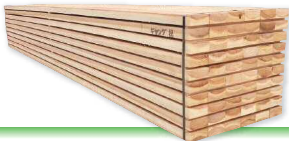
ギヤング挽 【G平割】 4m 45×90~120