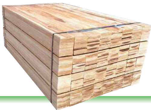
【G野地板】 2m 12・15×75~180