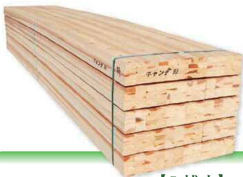
ギヤング挽 【G栈木】 4m 3m 27×60