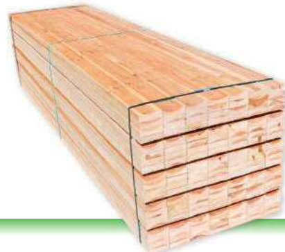
3m 30×90~120 【G間柱】(27厚、36厚も有)